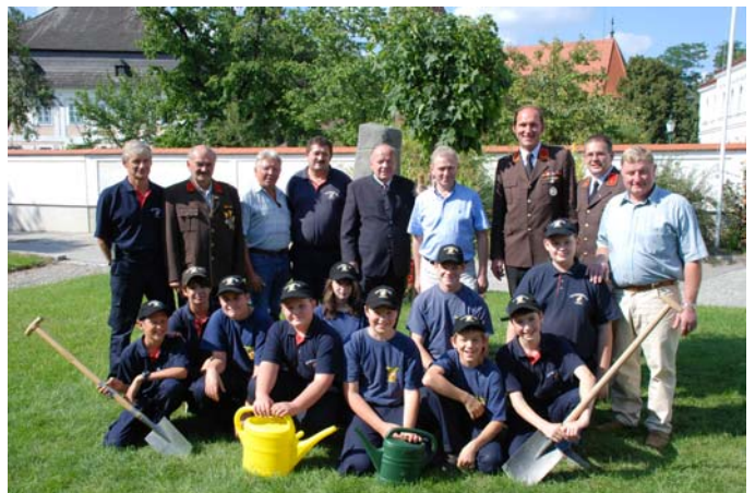
Tradition und Jugendförderung ...