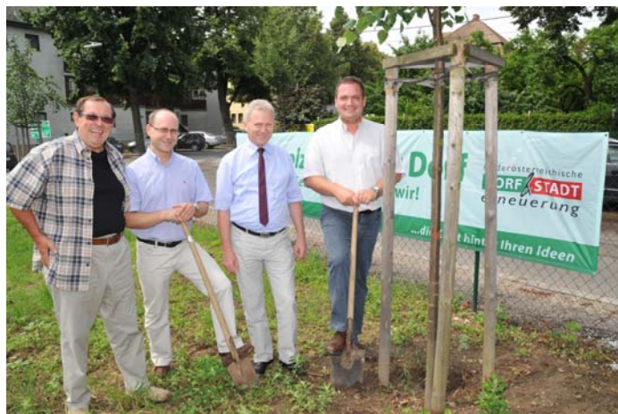
soziale Verantwortung und Ortsbildpflege...

... das sind nur wenige Bereiche, die unsere vielen Freiwilligen abdecken.