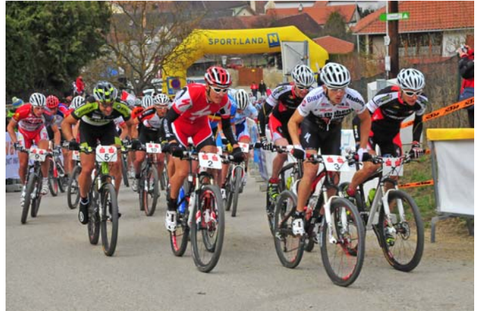
Unterhaltung und Sport ...